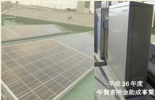
平成26年度 年賀寄附金助成事業