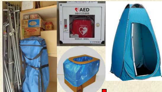
ぐみたてしきたんぼーるせいといれ 組立式段ボール製トイレ